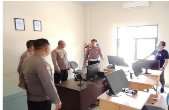
(Melakukan Pengecekan Ruang Uji Teori Bersama Personil Lantas Polres Lampung Barat)