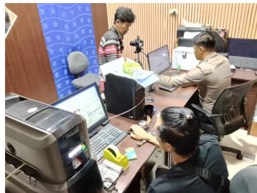
(Melakukan pengecekan performance pada Komputer)