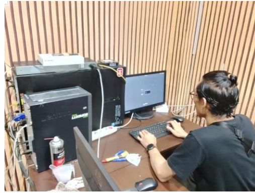
(Melakukan pengecekan konfigurasi pada aplikasi SIM)