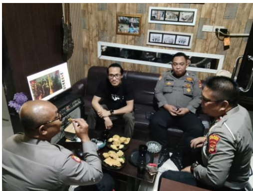
(Bertemu dengan jajaran satlantas polres lampung barat)