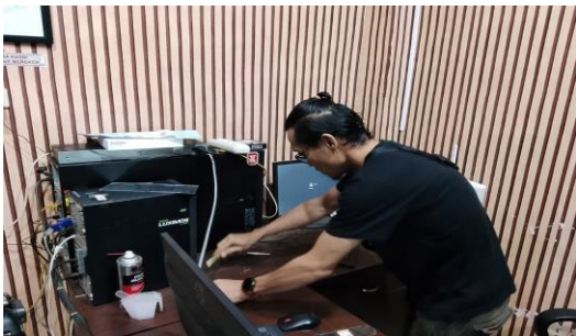
(Membersihkan dan melakukan pengecekan pada setiap CPU dan Monitor)