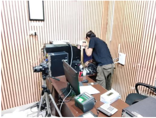
(Pembersihan pada area belakang dan penataan ulang area komputer)