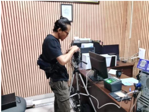
(Membersihkan Kamera Foto Pembuatan SIM)