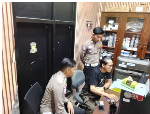
(Petugas Operator memberitahukan kendala pada saat cetak SIM kepada Teknisi dan PPK Pada saat melakukan supervisi)