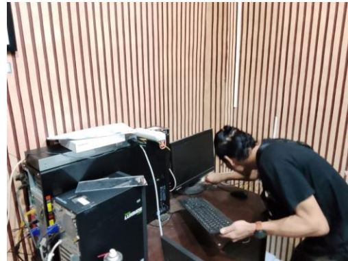
(Melakukan Pembersihan dan penataan ulang pada layar monitor dan keyboard)