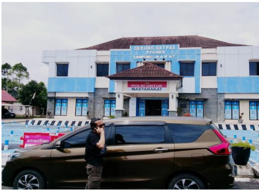
(Gedung Lokasi Pelayanan SIM Lampung Barat)