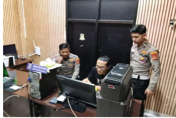
(Melakukan pengecekan pada komputer cetak sim)