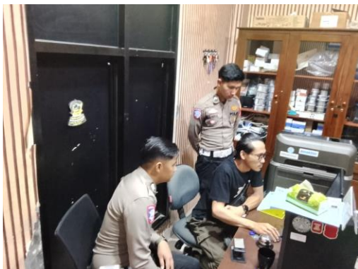
(Pengecekan Bersama personil lintas lampung barat pada komputer cetak sim)