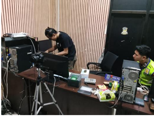
(Melakukan Pembersihan Pada Area Port pada CPU )