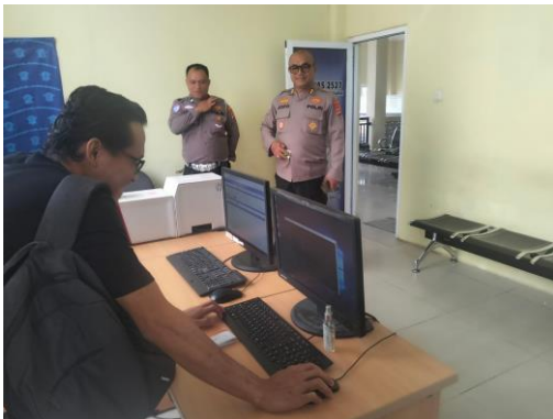
(Melakukan Pengecekan IP secara manual)