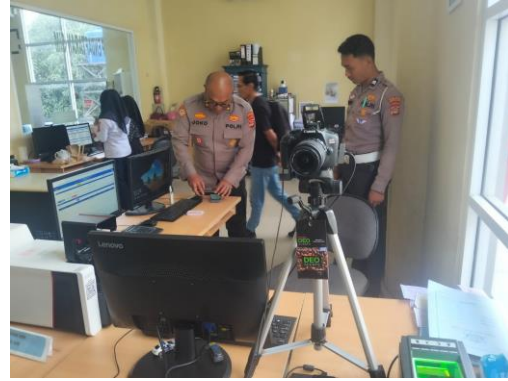
(Pengecekan area komputer identifikasi)