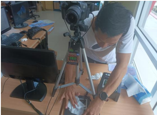
(Membersihkan dan melakukan kalibrasi signature pad)