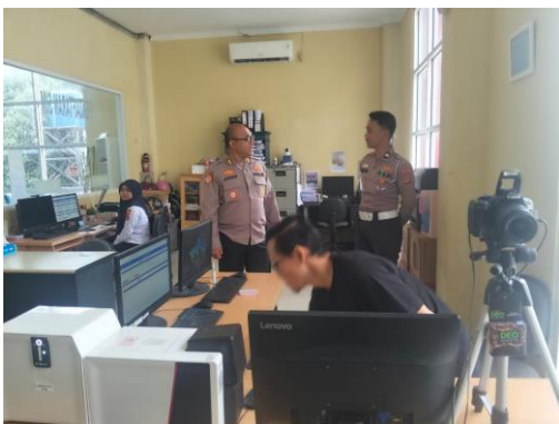
(Memastikan aplikasi sim berjalan dengan normal)