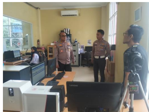
(Menunjukkan kepada operator bahwasanya aplikasi sim berjalan dengan normal )