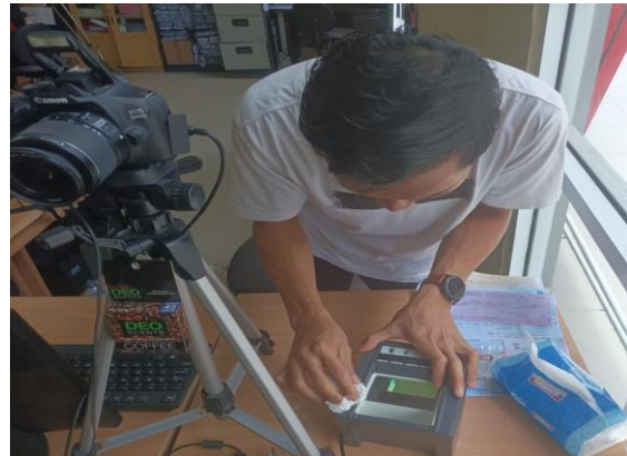
(Membersihkan dan melakukan kalibrasi fingerprint scanner)