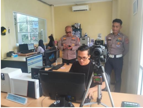
(Melakukan pengecekan komputer identifikasi)