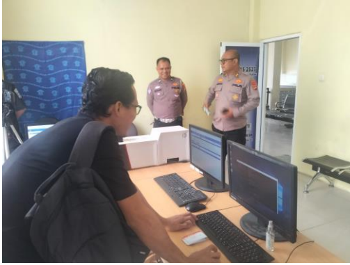
(Melakukan pengecekan konfigurasi pada aplikasi Ujian SIM)