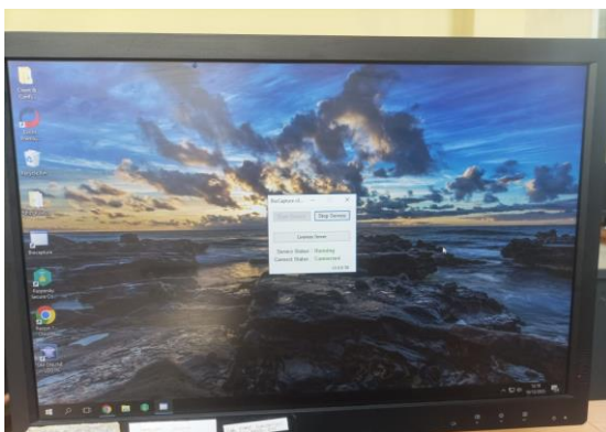
(Melakukan pengecekan dan memastikan aplikasi Biocapture menggunakan versi terbaru)