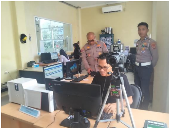
(Melakukan pengecekan fungsi semua perangkat dan aplikasi SIM di damping oleh PPK dan Operator SIM)