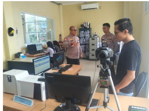
(Membersihkan dan melakukan pengecekan kamera printer cetak SIM)