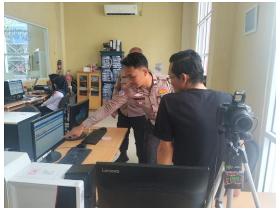
(Petugas Operator memberitahukan kendala pada saat cetak SIM kepada Teknisi dan PPK Pada saat melakukan supervisi)